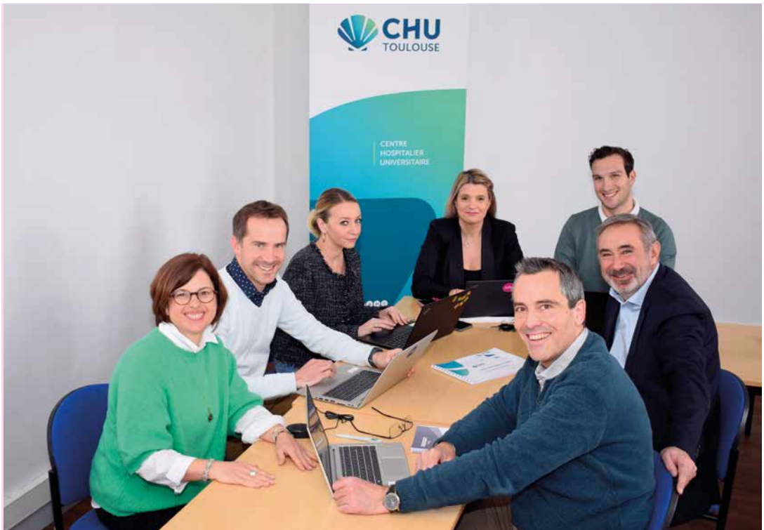
Le nouveau logo et la charte graphique ont été réalisés par l'équipe de la direction de la communication du CHU de Toulouse