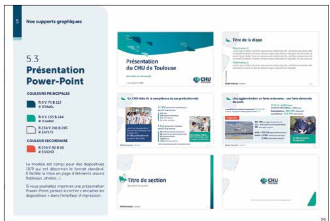
Quelques visuels du livre d'identité graphique